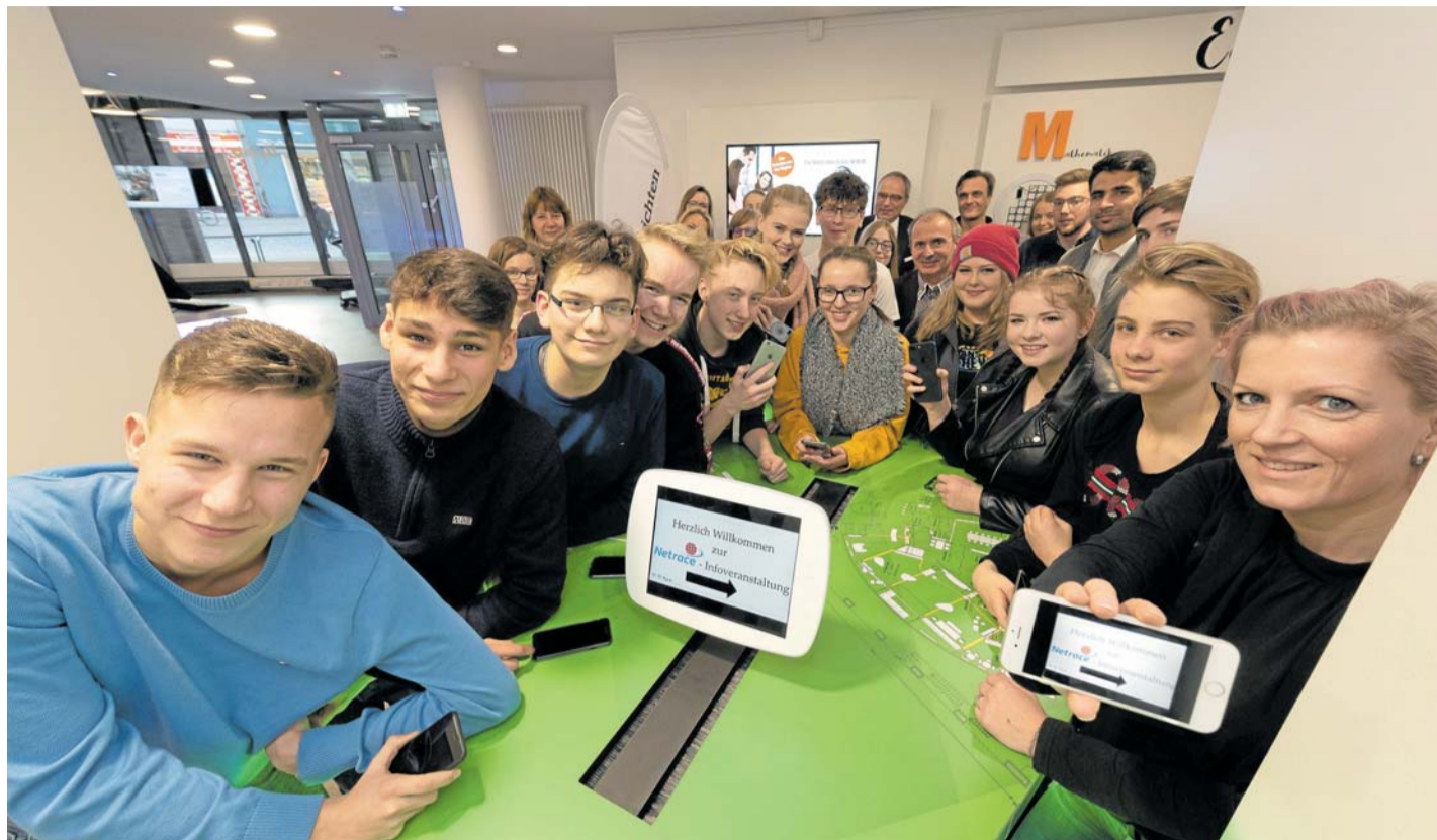
Am 19. Februar wird es ernst: Schüler und Lehrer liefern sich im „Update“ in Neumünster für Netrace warm.

Netrace ist eine Bildungsinitiative der Kieler Nachrichten und der Segeberger Zeitung. Kooperationspartner sind die Förde Sparkasse und seit diesem Jahr auch die Sparkasse