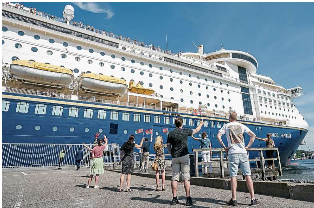
Neues Hygienekonzept, halbe Fahrgastzahl: Die „Color Fantasy“ pendelt seit Mitte Juni wieder.